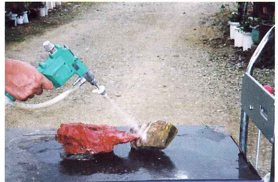
水石洗浄 (高水圧型ガン使用)