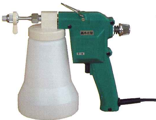
S-B型 (容器 850cc)