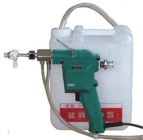
S-JET 101型 (5リットル容器)