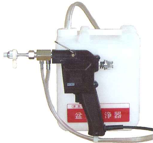
W-JET 101型 (5リットル容器)