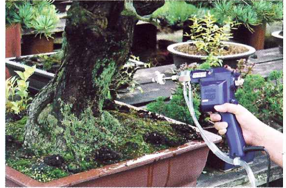
五葉松の幹洗浄 (コケ取り)