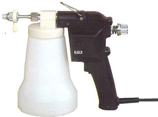
W-B型 (容器 850cc)